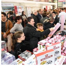
my Cake, Messe Friedrichshafen