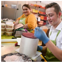
my Cake, Messe Friedrichshafen