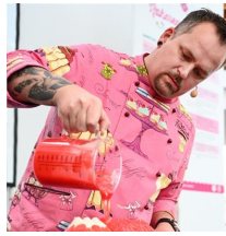
my Cake, Messe Friedrichshafen