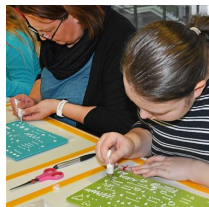
my Cake, Messe Friedrichshafen