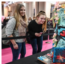
my Cake, Messe Friedrichshafen