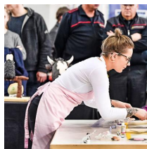
my Cake, Messe Friedrichshafen