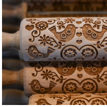
my Cake, Messe Friedrichshafen