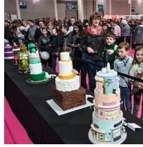
my Cake, Messe Friedrichshafen