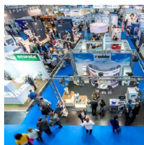
Fachausstellungen Heckmann GmbH