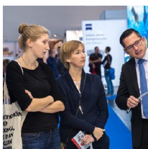
Fachausstellungen Heckmann GmbH