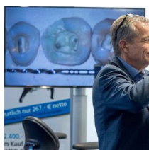
Fachausstellungen Heckmann GmbH