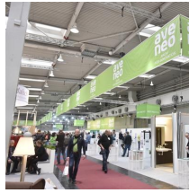
Fachausstellungen Heckmann GmbH