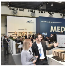
Fachausstellungen Heckmann GmbH