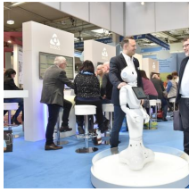
Fachausstellungen Heckmann GmbH