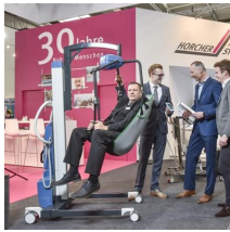
Fachausstellungen Heckmann GmbH