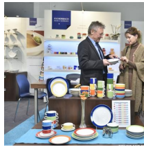
Fachausstellungen Heckmann GmbH