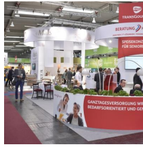
Fachausstellungen Heckmann GmbH