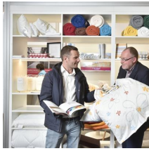
Fachausstellungen Heckmann GmbH