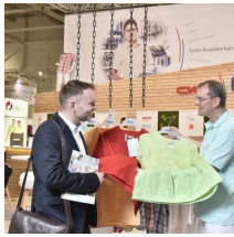
Fachausstellungen Heckmann GmbH