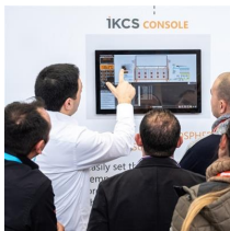
Andreas Schebesta / Messe München