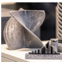
Andreas Schebesta / Messe München