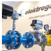
Andreas Schebesta / Messe München